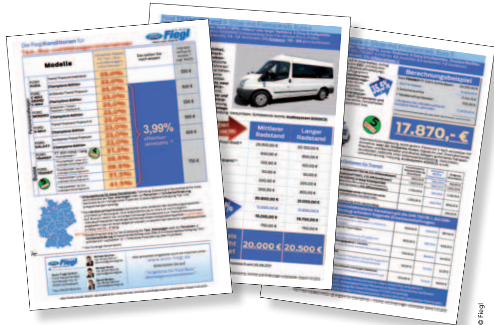
Das Angebot von Fiegl reicht vom Grand C-Max bis zum 17-sitzigen Ford Transit

10. November 2012 Köln, Messegelände, Kristallsaal