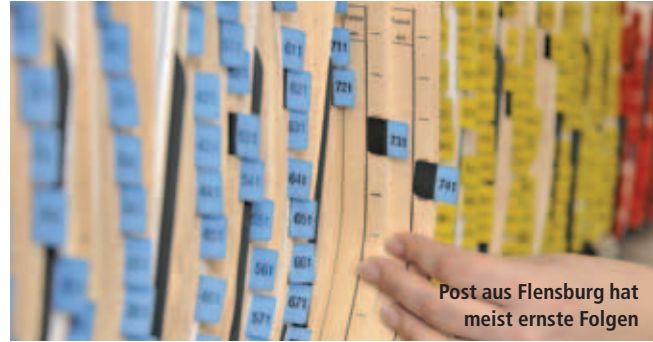
Post aus Flensburg hat meist ernste Folgen

Unter gewissen Umständen muss ein Fahrverbot keine Kündigung für einen Kraftfahrer nach sich ziehen.