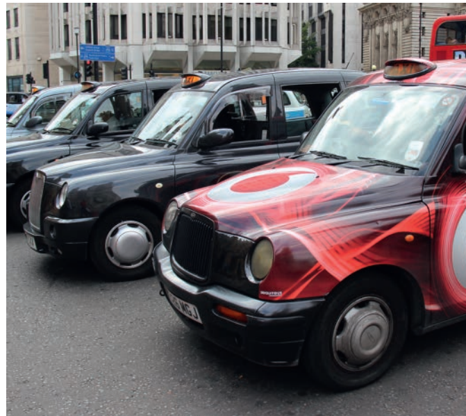
Sie bekommen ab Ende des Jahres elektrische Konkurrenz: Dann sollen TX5 durch London rollen

Leichtbau regiert Das Black Cab unterscheidet sich optisch nur geringfügig von seinem Vorgänger. Kein Wunder, denn erstens stehen die Briten auf Tradition und zweitens sind diese Taxis in aller Welt bekannt. Neu dagegen ist das, was unter der Haube passiert. Eine Leichtbau-Architektur aus Aluminium wurde entwickelt, die einerseits stabil und andererseits leicht genug ist. Rund